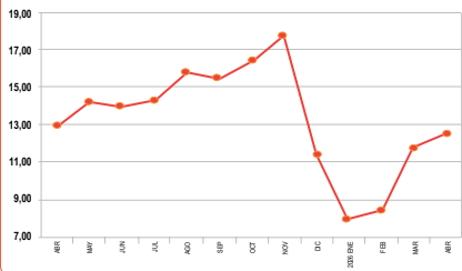
Santa Cruz: Evolución del Precio del Pollo Vivo pagado al Productor (en Bs./Kg.)